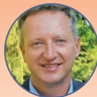
Bernhard Langner Schott AG