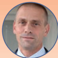
Dr. Holger Feldhege Bühler AG