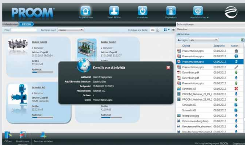
Die intuitive Benutzeroberfläche sorgt für den perfekten Überblick und einfachste Bedienung.

„PROOM ist bisher das einzige IT Werkzeug, über welches Lieferanten, Kunden, Mitarbeiter, Geschäftsleitung und IT Abteilung stets nur positiv gesprochen haben.“